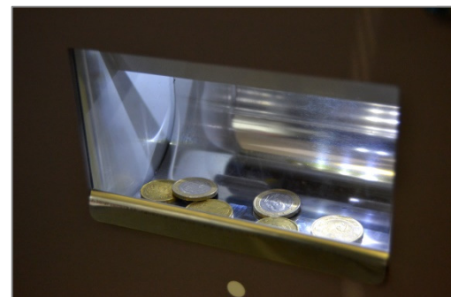
Dispensa 12 monedas por segundo