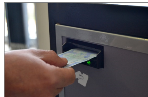
Todos los billetes aceptados son auténticos